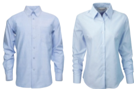
Cod. 1519 Oxford Manga Larga