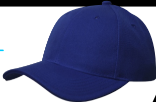
Cod. 1919 Gorra Drill