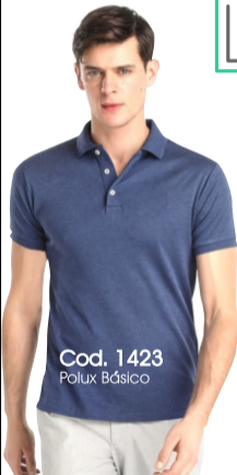
Cod. 1423 Polux Básico

100% Poliester, capa interna tipo algodón Manga corta Peso 220 gr Cartera (3,5*16) 2 botones Caballero- 3 botones Dama Ancho cuello 8cm/ Ancho puño 2cm