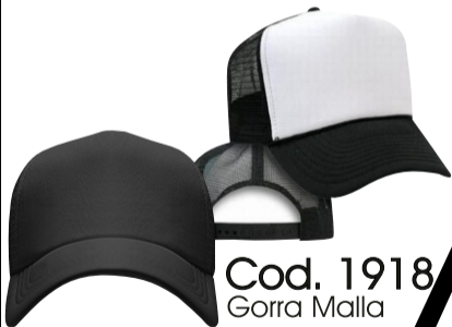
Cod. 1918 Gorra Malla