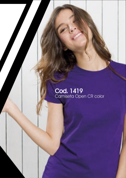
Cod. 1419 Camiseta Open CR color

Camiseta Open End 180 gr 100% Algodón Cuello de 2.5 cm en Rib Costura de 10 puntadas por pulgada Dobladillo ruedo inferior y mangas 2 cm a dos agujas