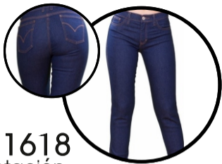
Cod. 1618 Jean dotación