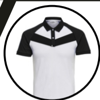
Cod. 1424 Polux 2Tonos

Tecnología que permite captar y secar la humedad causada por la transpiración rápidamente, permitiendo que el usuario este cómodo y fresco.