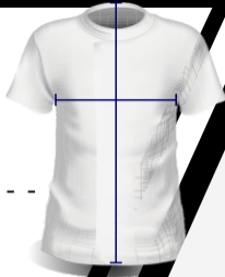
IMAGEN DE REFERENCIA PARA TOMA DE MEDIDAS