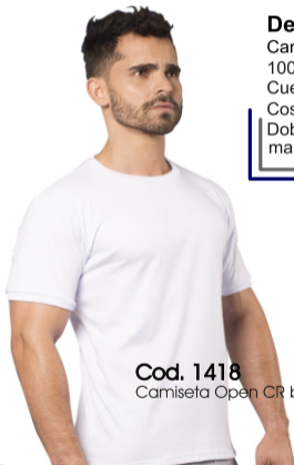
Cod. 1418 Camiseta Open CR blanco