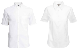
Cod. 1518 Oxford Manga Corta

DISPONIBLE EN BLANCO Y AZUL CLARO. A PARTIR DE 24 UNIDADES