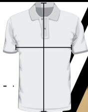
IMAGEN DE REFERENCIA PARA TOMA DE MEDIDAS