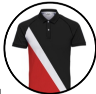
Cod. 1425 Polux 3Tonos